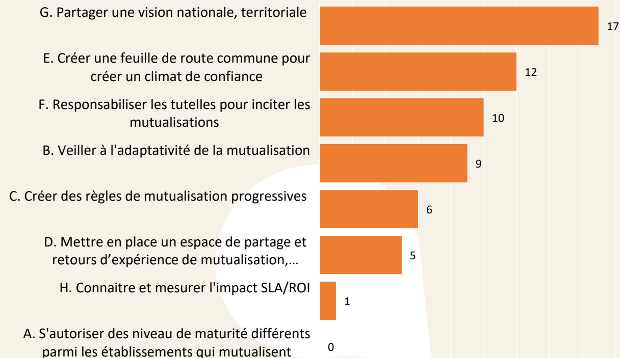
Priorisation des leviers d'accélération

Autre point évoqué dans les échanges : Identifier un porteur formé au leadership.