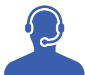
RÉGULATEUR / OSNP